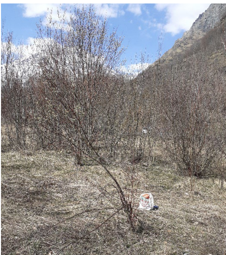
8, foto del 4 aprile