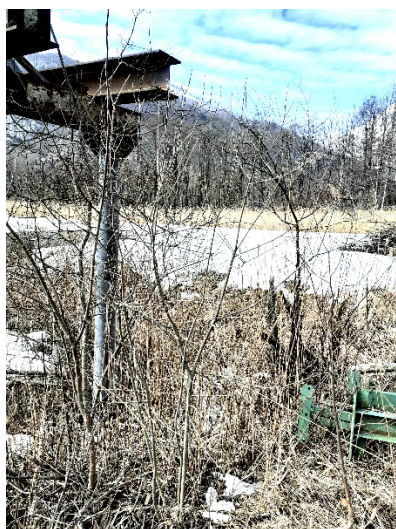
5A foto dell'8 marzo