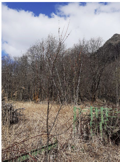
5A foto del 4 aprile