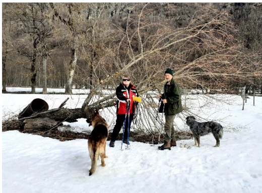
1, foto dell'8 marzo