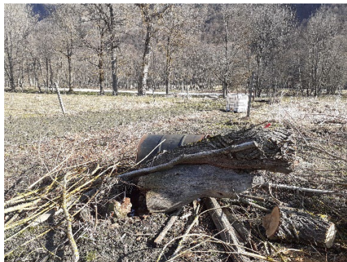
1, foto del 4 aprile