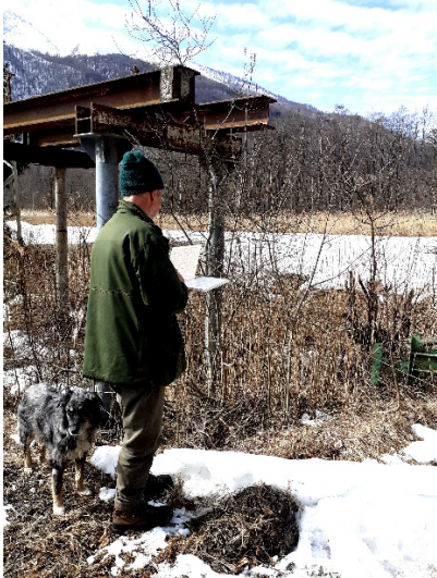
5B foto dell'8 marzo