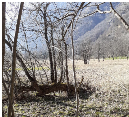
2, foto del 5 aprile