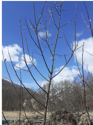
5 B foto del 4 aprile