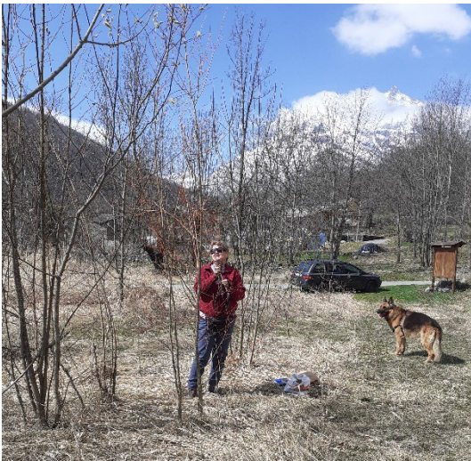
6, foto del 4 aprile