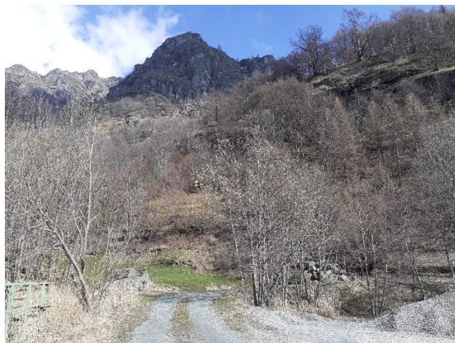
4, foto del 4 aprile, a destra in secondo piano, il n 3 dell'8 marzo